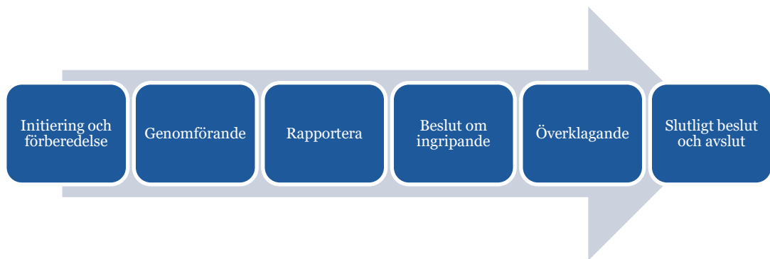
Figur 1. Svenska kraftnäts tillsynsprocess enligt Instruktion för tillsyn enligt säkerhetsskyddslagen (2018:585), Svk 2023/1539.

Svenska kraftnät bedriver i huvudsak tillsyn enligt nedanstående process. Svenska kraftnät har löpande utvecklat och reviderat processen för att anpassa vårt arbetssätt till tillsynsmyndigheternas befogenheter som infördes den 1 december 2021 samt utifrån de erfarenheter myndigheten fått genom handläggningen av tillsynsärenden.